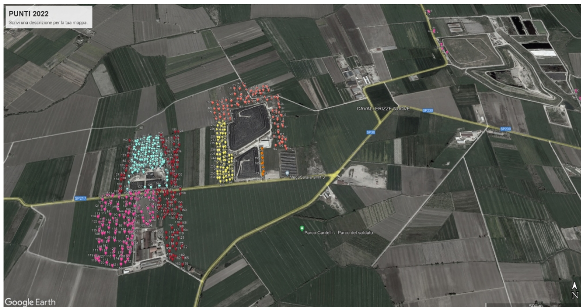
Foto 1 - 4 – aerofotogrammetrie delle particelle con indicazione dei punti di misura.